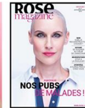
Rose Magazine N°17 | Automne-Hiver 2019-2020