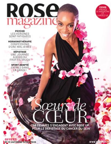
Rose Magazine N°19 | Automne-Hiver 2020/2021