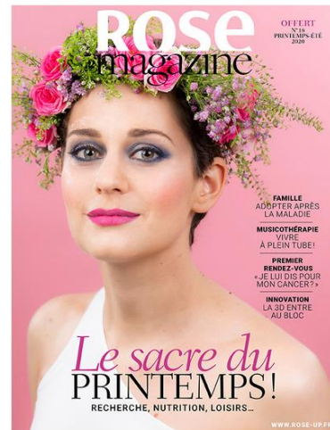
Rose Magazine N°18 | Printemps-Été 2020