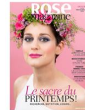
Rose Magazine N°18 | Printemps-Eté 2020